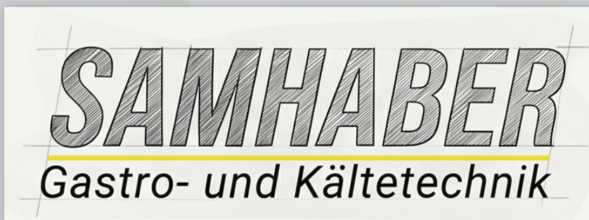
KONZEPT / SKETCH

Die Begriffe „Gastro- und Kältetechnik“ werden in einer feineren, weit laufenden Versalschrift darunter gesetzt, um die Fachbereiche klar zu benennen, ohne die Dominanz des Hauptnamens zu stören.